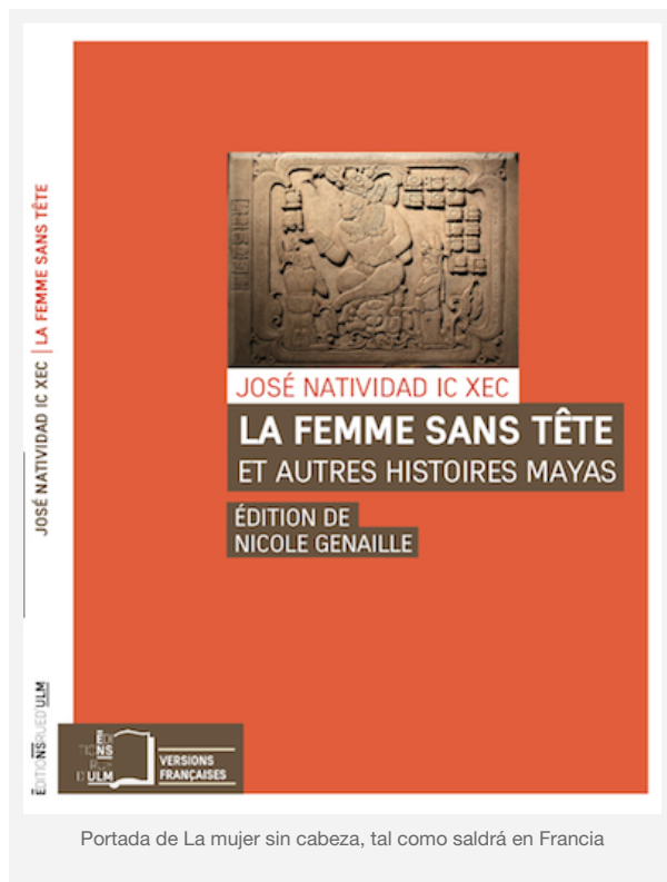
Portada de La mujer sin cabeza, tal como saldrá en Francia